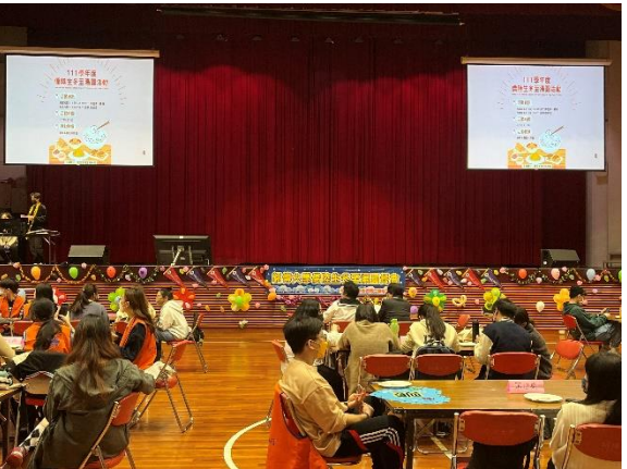
僑陸生參與冬至湯圓餐會