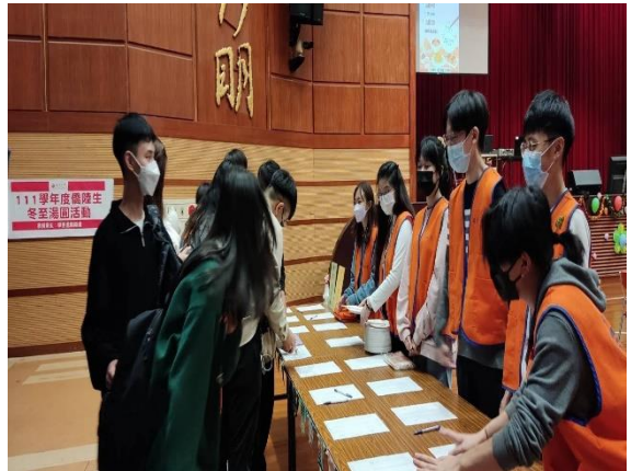
僑陸生排隊報到簽名