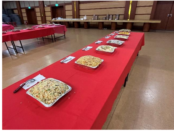
僑陸組準備豐盛餐點及湯圓