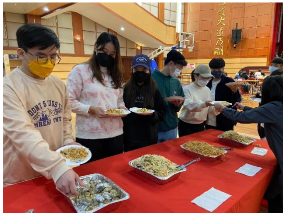
僑陸生排隊領取豐盛餐點及湯圓