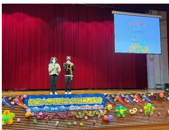
主持人說明冬至由來