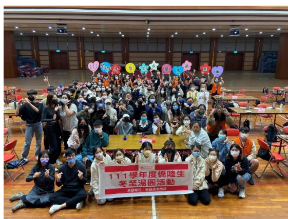
學務長與僑陸師生合影留念