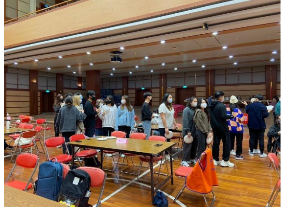
僑陸生依序排隊領取餐點及湯圓