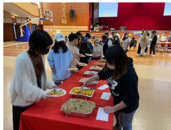
同學配戴口罩並依序排隊取餐