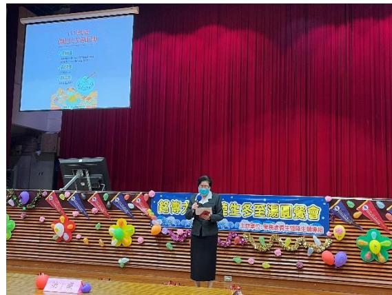
學務長蒞臨關懷僑陸生