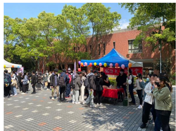
異國特色料理攤位人潮絡繹不絕