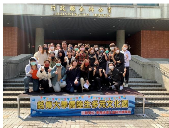
師長與僑陸生同學合影留念