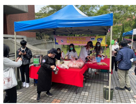
海青班數媒科馬來西亞拉茶表演