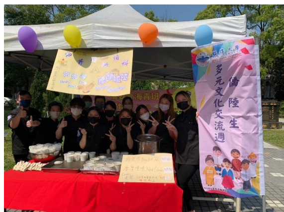
海青班烘焙科同學合影留念