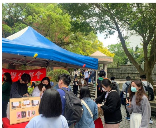
同學排隊購買僑生同學會攤位美食