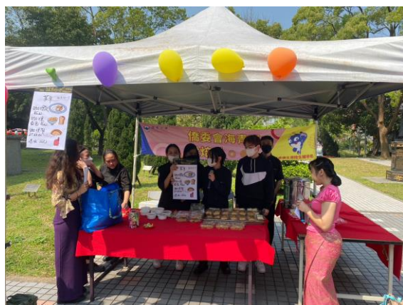
同學介紹海青班烘焙科異國料理