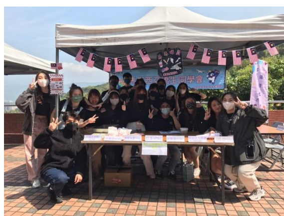
僑生同學會合影留念