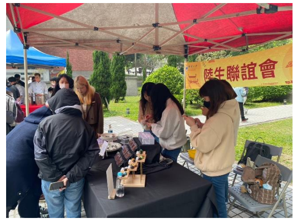
同學選購陸生聯誼會美食