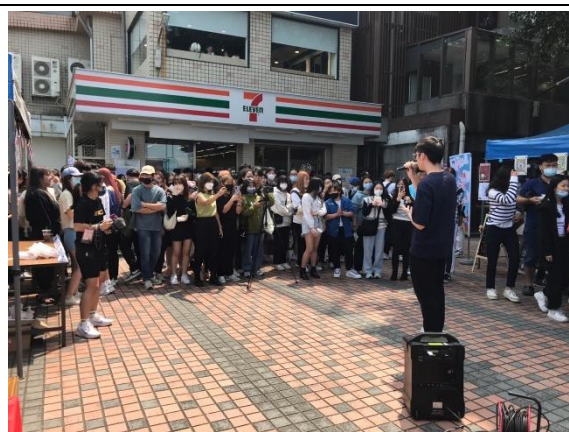
僑生同學抒情歌曲演唱