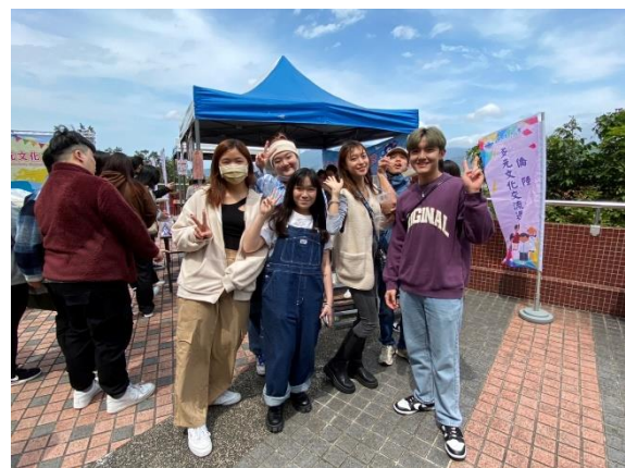
香港同學品嚐馬來西亞料理