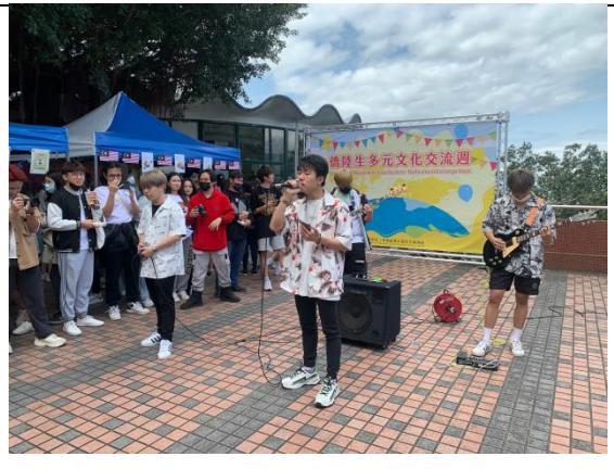
僑生演唱及電吉他伴奏