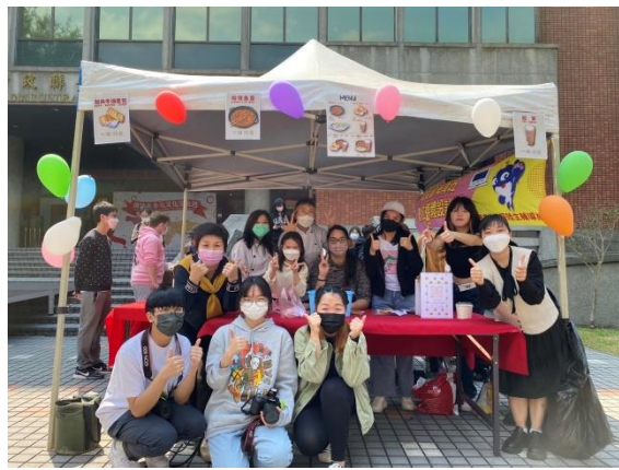
組長與海青班數媒科同學合影留念