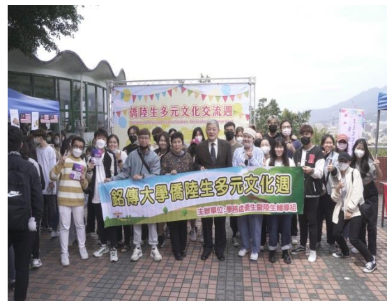
師長與僑陸生同學合影留念