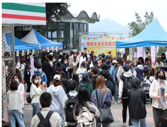
異國料理特色攤位人潮絡繹不絕