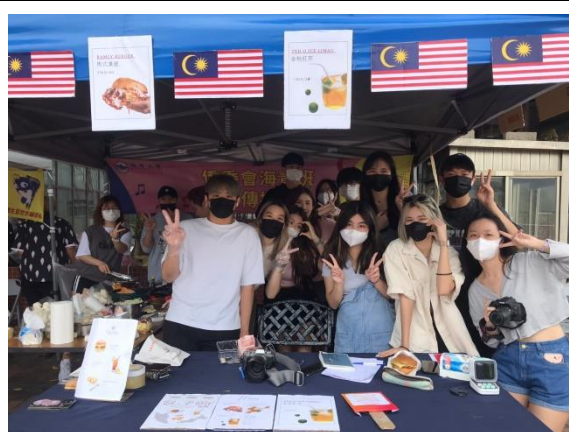
海青班大傳同學合影留念