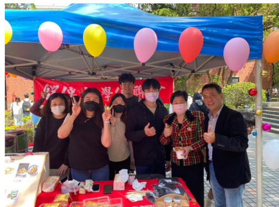
楊處長與僑生同學合影留念