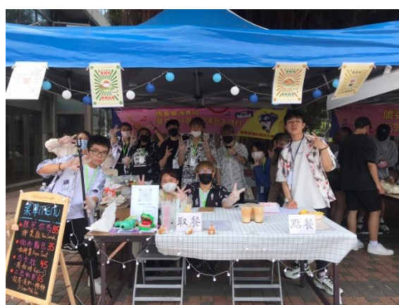
海青班華藝科合影留念