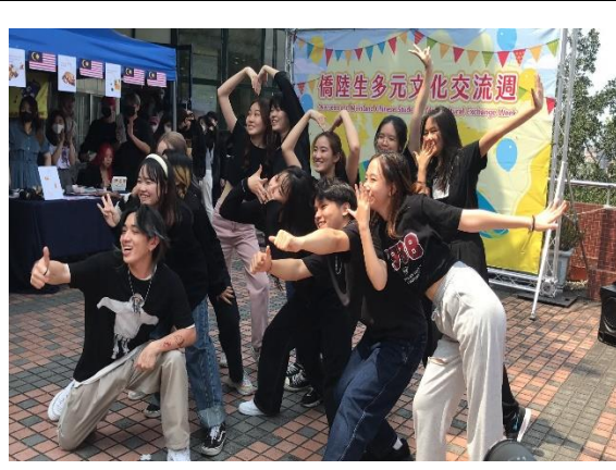
僑生同學展現青春活力熱舞