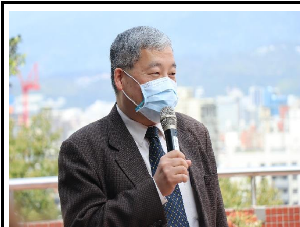
學務長蒞臨致詞勉勵同學